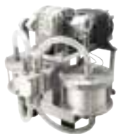
• Efficient aluminum motor double piston